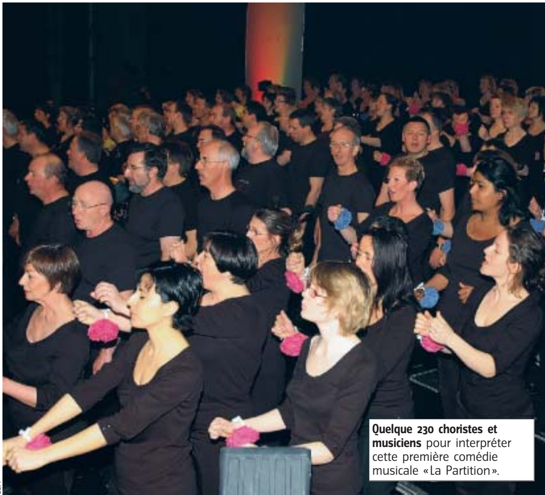
Quelque 230 choristes et musiciens pour interpréter cette première comédie musicale «La Partition».

Cette comédie musicale sera interprétée une nouvelle fois à l'Arsenal à Metz le 14 juin prochain, les organisateurs espèrent pouvoir présenter une dernière fois cette comédie musicale dans le cadre des «Restos du cœur», en 2009, au Galaxy d'Amnéville. ■